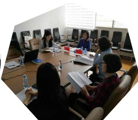
“加拿大外交与政策”专场